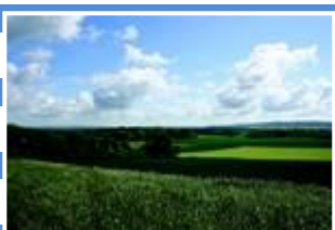
Bocage du Boulonnais