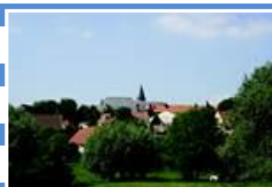
Vue sur Samer