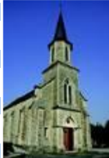
Eglise de Carly